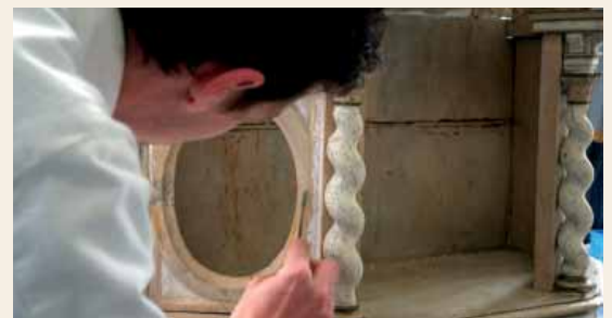
↑ DERNIÈRES RETOUCHES SUR L'AUTEL AVANT QUE DE LE RESTITUER AUX CLAYETTOIS

textiles, papiers) mais sont spécialisés plus particulièrement dans le bois archéologique et le bois sec historique et ethnographique. Dans le premier cas, Arc Nucléart a restauré la pirogue retrouvée à Gueugnon dans les boues de l'Arroux. Et qui est aujourd'hui en exposition à Cosne sur Loire pour une histoire de la navigation fluviale. L'autel de Sainte-Avoye se classe dans la seconde catégorie des bois historiques.