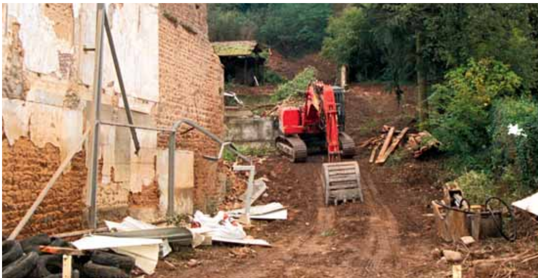
↑ RUE LAMARTINE, ENTRE SAINTE-AVOYE ET L'IMPRIMERIE CLAYETTOISE, UN NOUVEAU PARKING QUI SERA LE BIENVENU

L'étude montre les diverses classifications des usagers du stationnement clayettois. Il y a le visiteur courte-durée. Celui qui ne passe pas plus de deux heures sur un stationnement, qui vient faire ses courses en général; le visiteur longue-durée qui stationne plus de deux heures, comme c'est le cas pour le touriste; le migrant qui est l'actif travaillant dans le secteur et qui se gare devant son lieu de travail, de préférence; le résident qui peut être présent la nuit et absent le jour ou la voiture-ventouse qui ne bouge que très rarement. Toutes les études sont formelles, c'est le migrant qui porte la solution en lui. Si celles et ceux qui arrivent le matin à 9 heures, repartent à midi et reviennent à 14 heures jusqu'au soir acceptent de jouer le jeu et vont se garer sur les parkings voisins plutôt que le long du trottoir, la question est réglée. Et le commerce ne s'en portera que mieux. C'est aussi une affaire de civisme élémentaire.