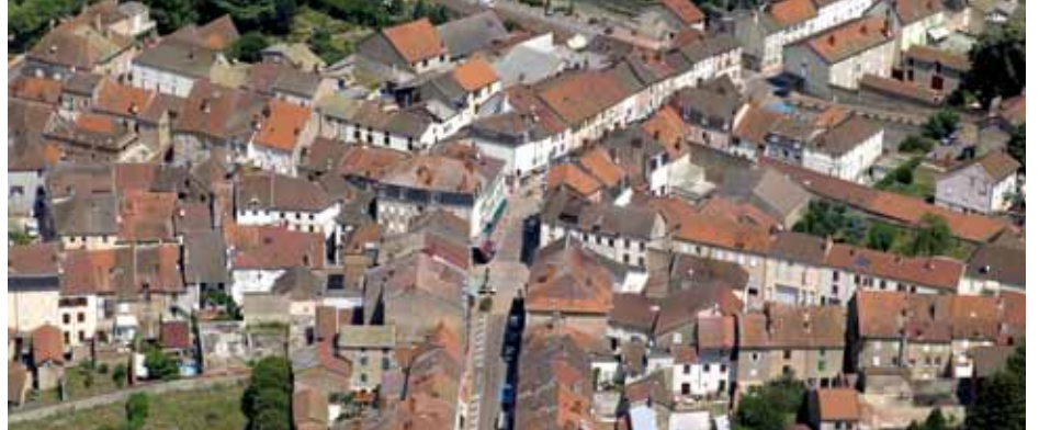
↑ LES RUES CENTRALE ET LAMARTINE. LA COLONNE VERTÉBRALE DE L'URBANISME COMMERCIAL RESTE À REVISITER

C'est à un grand chantier que les clayettois doivent se préparer et qui va transformer radicalement le visage de leur ville. L'enjeu est essentiel pour l'avenir. C'est le chantier de la décennie.